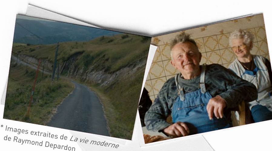
* Images extraites de La vie moderne de Raymond Depardon